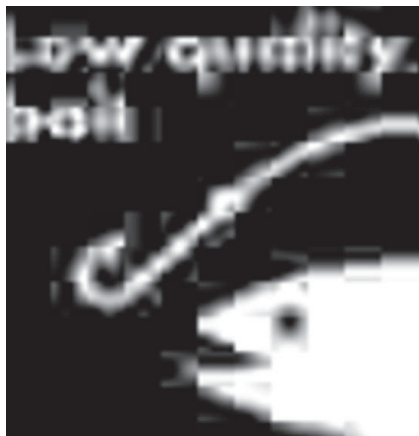
Figure 3 e 4: meme che identificano il troll

La risposta al questionario di B, chiaramente provocatoria, fa leva sulle posizioni del gruppo decisamente avverse ai “no vax”, considerati sostenitori di una credenza antiscientifica dettata dall’ignoranza. Il primo utente a parlare di troll si basa sull’incoerenza delle risposte. Per dare continuità alla propria azione, il troll interviene di nuovo con “io sono dottore di me stesso”. Identificato come “cretino”, reagisce con un insulto ( mammt ), quindi viene smascherato con due meme: il primo ( pink guy triggered ) ironizza sull’effetto (mancato) del troll , che è quello di triggerare gli altri; il secondo ( Low quality bait ) qualifica la sua “attività di pesca” come scarsa, anche attraverso la bassa definizione dell’immagine.