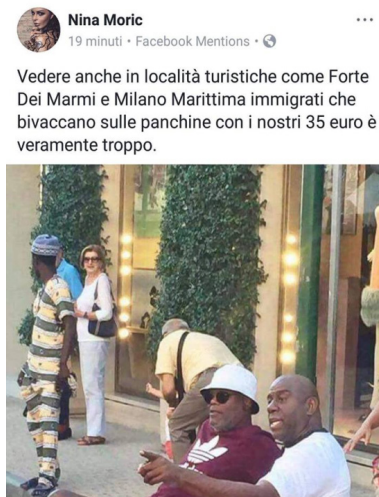
Figura 2: il post di Nina Morić.

Le discussioni che presentano le occorrenze più elevate riguardano: un post di Nina Morić, la modella e showgirl allora iscritta al partito neofascista Casa-Pound , la quale aveva diffuso la foto di Samuel Jackson e Magic Johnson (Figura 2) presentandoli come immigrati parassiti che, secondo la propaganda dei partiti della destra, costerebbero agli italiani 35 euro al giorno (127 post/occorrenze 32; 19 agosto 2017); segue un sondaggio su come si dovrebbero trattare i troll all'interno del gruppo (post 147/27 occorrenze; 21 agosto 2017) e un thread sull'aggressività nelle piattaforme del gaming (380 post/21 occorrenze; 15 agosto 2017).